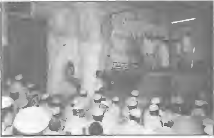
تقام الخطب والأناشيد الدينية بساحة الرياض أيام الاحتفال السنوي (الحول) وتظهر في الصورة المدخل الرئيسي لمنزل الحبيب علي الحبشي في سيئون